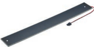
Solarpanel mit 2 Bef.löchern 13 124.7001

Die Antriebe verfügen über intelligente Kraftmessung, Behangschutzfunktion in Auf- und Abrichtung sowie eine geräuschlose Softbremse. Die Plug & Play Variante /D+ macht die Installation mit selbstlernenden Endlagen noch einfacher.