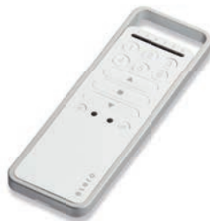
VarioCom 6-Kanal Handsender 28 445.0002