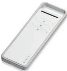
MonoCom 1-Kanal-Handsender 28 405.0002

Unabhängig vom Stromnetz wird der Wandsender einfach an der gewünschten Stelle befestigt. So bewegt man den motorisierten Rollladen ganz bequem. Die Ansteuerung von zwei Zwischenpositionen über einen Doppelklick auf die Auf- und Abtasten ist ebenfalls möglich.