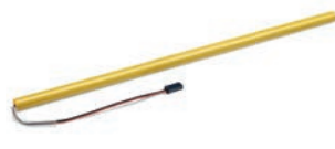
Akku-lang 13 710.3802