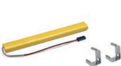
Akku-kurz mit Halteklammern 13 710.4802 & 16 307.1001 (2x)

Hochwertige, langlebige Solarpanels zum Anschrauben bzw. Kleben. Die Montage erfolgt in Antriebsnähe bzw. am Rollladenkasten. Das Panel wird so angebracht, dass möglichst viel direktes Sonnenlicht empfangen wird.