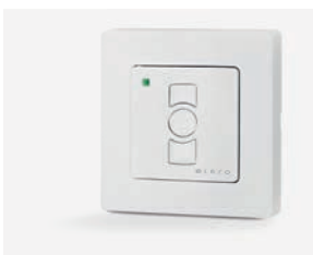
MonoTec-868 1-Kanal-Wandsender 28 650.0002

Ausschließlich diese Funksender sind mit RolSolar kompatibel. (Artikelnummern mit Index 2)