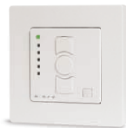
QuinTec-868 5-Kanal Wandsender 28 655.0002