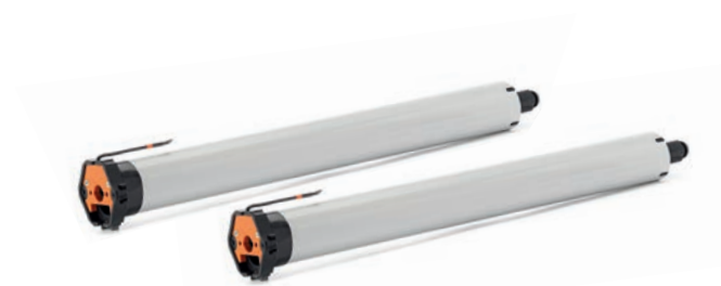
RolSolar M10-868 DC, M20-868 DC | /D+ M10-868 DC, /D+ M20-868 DC

Die Bausteine für eine solare Motorisierungslösung haben wir zu Bundles zusammengefasst. Dabei wählen Sie zwischen verschiedenen Antriebstypen sowie Solarpanel und Akkus in unterschiedlichen Bauformen. So erhalten Sie eine Lösung, die ganz auf die Gegebenheiten vor Ort zugeschnitten ist. Die Bundle-Übersicht finden Sie im Prospektbeileger.