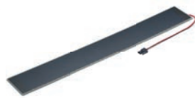
Solarpanel mit Klebestreifen 13 125.1901