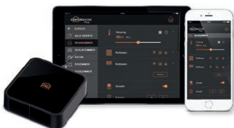
Centero Home Smarte Hausautomatisierung

COM-Handsender überzeugen durch modernes Design und den ergonomischen, bedienerfreundlichen Aufbau. Sie sind, wie die Funkwandsender, zur Bedienung von einem oder mehreren Rollladen geeignet und mit denselben Funktionen ausgestattet.