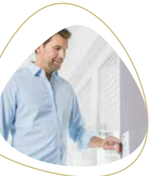
Wandsender hat seinen festen Platz und reagiert auf Knopfdruck