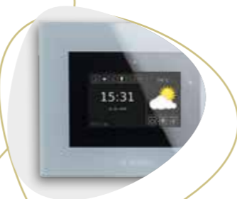
CentralControl CC51 und CC31 Hauszentrale zur Organisation, Bedienung und Automation