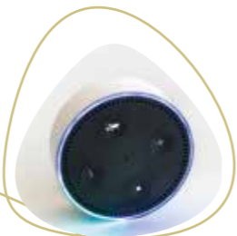
Sprachsteuerung bringt Ihr Zuhause auf Zuruf in Bewegung