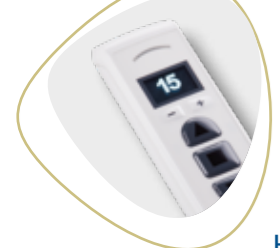
Handsender für Ihr Mehr an Flexibilität und Komfort